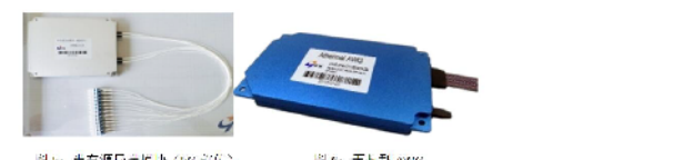
图5: 工业级连接器 图6: 工业级连接器 主要应用于国家重大工程、中国通信、中国国防、中国“电”等投资的通信网络建设...