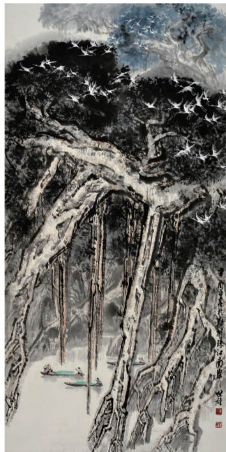
梁世雄 小鸟天堂 137cm×68.5cm 纸本设色 1981年

从梁世雄20世纪五六十年代的山水画作品来看，写生取景是其最主要的特点，所画均来自现实生活的所见所感，突破了古代传统图式的限制，而在笔墨表现上，一方面注重体会物理的内在规律，在描绘物象形、体、质的同时，强调调感、色感、空气感，传达出真实而鲜活的生活感受，另一方面也注重锤炼笔墨，在笔线概括勾勒的同时，注意墨韵与色感的交融，延续着岭南一派对于空间气氛的营造。70年代末，梁世雄逐渐成长为岭南画派第三代的中坚力量。1977年，他参加了以关山月、黎雄才为首的广东国画创作组，为毛主席纪念馆绘制大型主题创作，先后深入井冈山、韶山、娄山关、延安采风，合作创作了《农讲所颂》