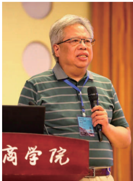
中国艺术经济研究院院长 长西沐

在数字金融发展的过程中一般强调了两个核心：一个是数字金融体系发展的核心，一个是数字金融系统构建与发展的核心，即数字金融体系发展的基础与核心是数字资产，而与数字资产相适应的系统体系数字信用是数字金融发展的核心。也就是说，建构于数字资产基础上的数字信用，是数字金融发展体系核心上的核心，一个讲数字金融体系，一个讲数字金融系统本体。