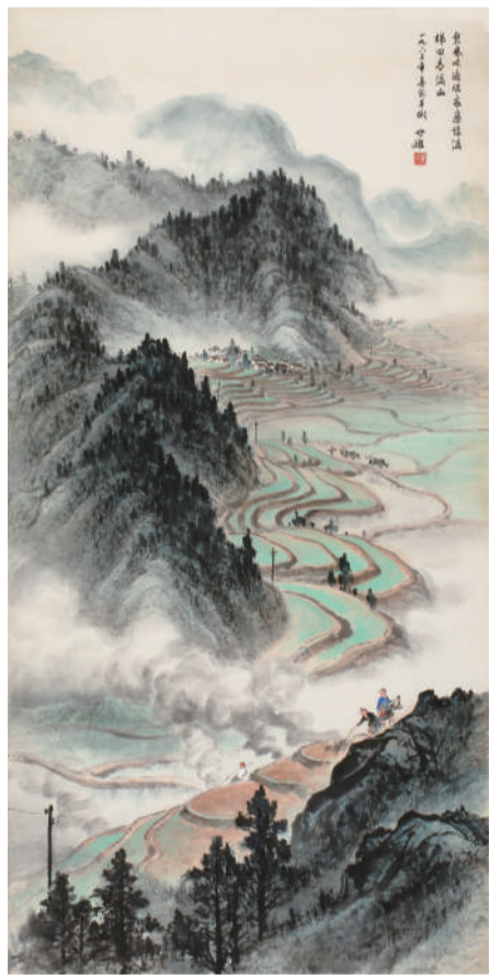
梁世雄 东风吹遍瑶家寨，绿满梯田青满山 148cm×74cm 纸本设色 1963年

90年代以来，梁世雄虽已是花甲之年，但写生创作的脚步依然没有停止，国内游张家界，登泰山，观九寨、黄龙，国外则先后赴日本、泰国，远游加拿大及欧洲诸国，饱览异域风情。在这一时期，梁世雄又以“忆写”的方式，在多年实地写生观察感受的基础上，通过记忆的筛选，进行意匠经营，反复锤炼、提升画境，其山水画愈发气象恢宏，写意精神更加明显，在笔墨设色上也更