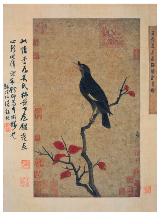
[宋] 吴元瑜 红叶小鸟图轴 42cm×25cm 纸本设色

吴元瑜为北宋中期画家，其活跃期应在11世纪后半期。吴元瑜，字公器，河南开封人，曾为吴王府直省官，后为光州兵马都监，官至武功大夫，合州团练使。善画，师崔白。《图绘宝鉴》说他善绘花鸟人物山林。宋御府收藏他的画多达一百八十幅，题材以花卉鸟禽为主，也有行旅及佛像鞍马。张丑在《清河书画舫》中说仇英“人物师吴元瑜”，可见他的绘画相当全面。北宋初期的花鸟画以院体为主流，继承了五代黄筌、黄居采父子的写实风格，精妙细腻。到宋神宗朝，崔白在精微的工笔中注入了写意技法，把两种笔法和和谐地融合在绘画中，风格清新自然。台北故宫博物院藏有的《双喜图》，清新流利，构图温馨，是崔白传世最精美的作品。