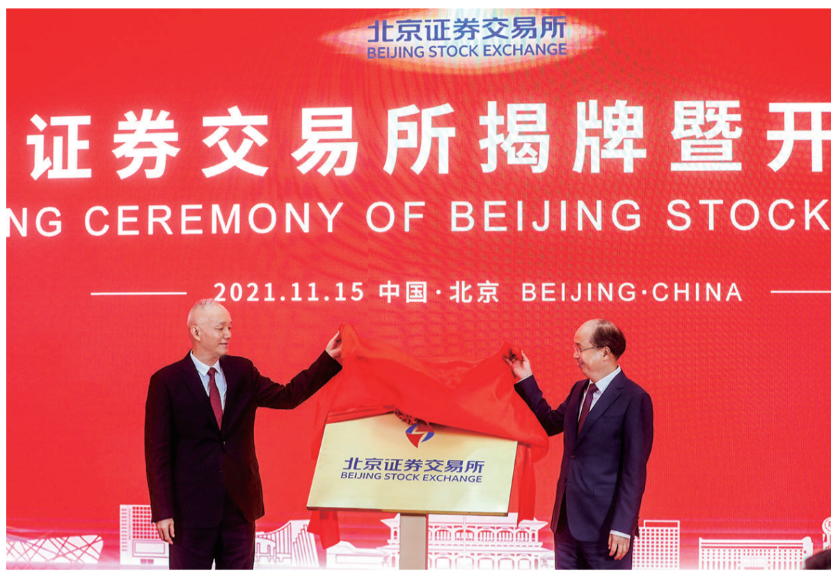
北京证券交易所揭牌暨开市仪式现场。北京市委书记蔡奇(左)、证监会主席易会满(右)共同为北京证券交易所揭牌。